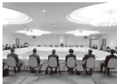
▲第2回理事会の様子