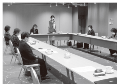
▲女性部会合同幹部会議の様子