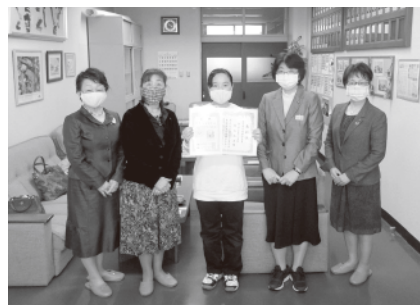
左から、作品審査会の様子、税務署長と一緒に見学した作品展、受賞者の学校を訪問し行った表彰の様子