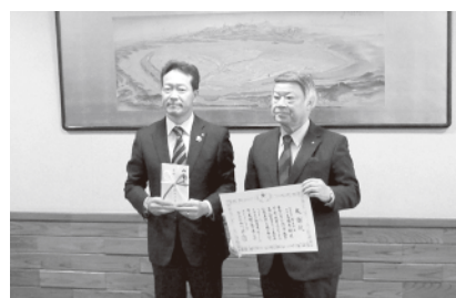
▲旭川市新型コロナウイルス感染症 対策基金へ寄附