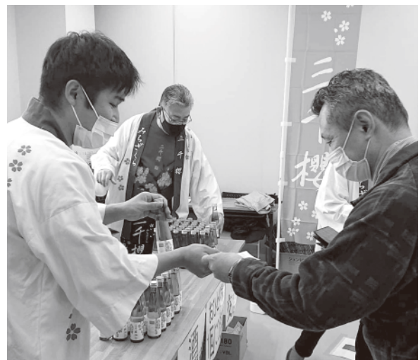
三千櫻新酒完成記念プレゼント企画

東川町農協もオリジナルの瓶・ラベルを使用し国内販売や海外への輸出事業も行っていく取り組みを始めています。