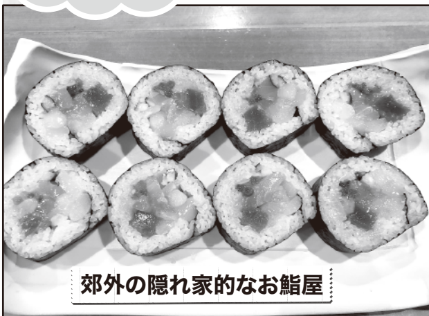
郊外の隠れ家的なお鮓屋

前号に引き続き第2回も 広報誌の編集を 担当している 広報委員7名の方の 『オススメ店』です