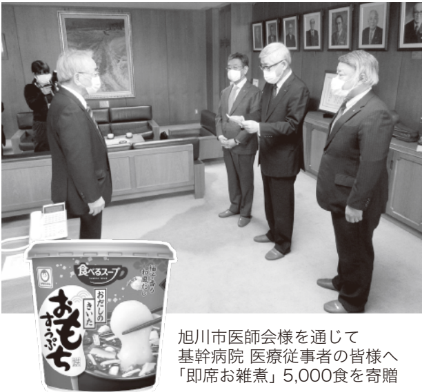
旭川市医師会様を通じて 基幹病院 医療従事者の皆様へ 「即席お雑煮」5,000食を寄贈

常に危険と隣り合わせの環境にあっても、日々奮闘され最善を尽くす医療従事者の皆さまへ感謝の気持ちを伝えようと、旭川商工会議所、旭川東・中法人会が企画いたしました。