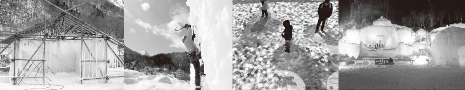
氷瀑まつり制作の様子とデジタルアートやライトアップで彩られた会場の様子

らないなどの弊害が出るので、井戸掘りには時間をかけ良い井戸になるよう何度も作り直すこともあります。気温が-3度以下になると水を汲み上げ、糸を張った骨組みにかけていきます。1所のポンプから12、3本のホースを取り付け水掛け作業を行うのですが、水を一度汲み上げると水掛け作業が終了するまでポンプの水は24時間出し続けます。