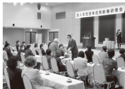
▲四団体新春研修会にて抽選会