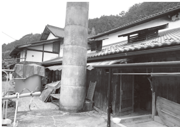
「旧三千櫻酒造蔵」岐阜県中津川市

「水と向き合い、米と向き合い、麴に語りかけ、麴の声を聴く」決して気負わず手を抜かず、自然を信じて酒を待つ。それが三千櫻酒造の酒造りです。