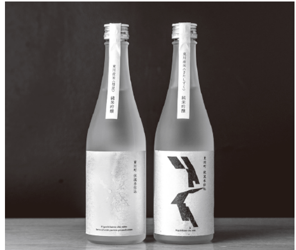
東川町株主制度（ふるさと納税）返礼品

観光協会、小売店、飲食店、菓子店、温泉旅館など様々な関係者が集まり、商品開発や販売戦略などの検討会も開催されています。