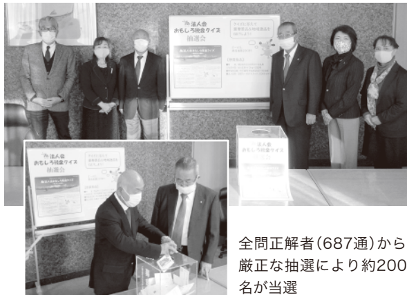
全問正解者(687通)から厳選された約200名が当選