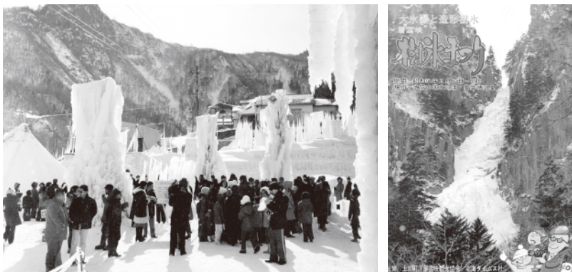
第1回氷瀑(樹氷)まつりの様子と当時のポスター

今年で46回目を迎える氷瀑まつりですが、例年であれば道内外や海外からのお客様12万人ほどが訪れにぎわうところですが、今回はコロナ禍にあり集客は厳しいものとなっております。