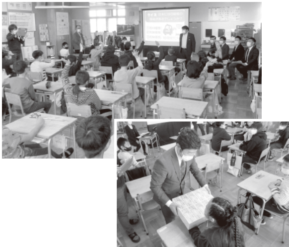
▲租税教室の様子(朝日小学校)

また、例年「おもしろ税ミナ〜ル」内で青年部会が主導となり実施している租税教室・市長は君だ子ども税金コーナーについては、イベントの中止に伴い中止とした。