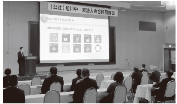
経営セミナー(3/8)の様子